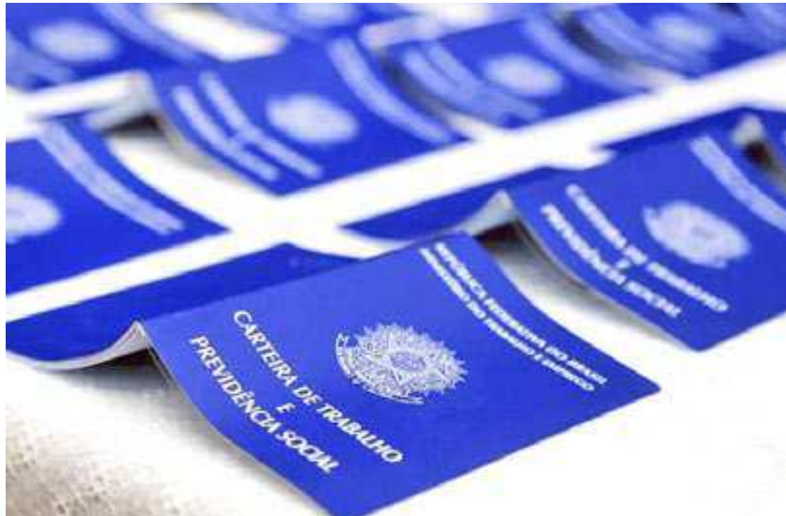
Segundo o IBGE, o número de desempregados atingiu 8,2 milhões de fevereiro a abril

A taxa atual marca um período de retomada do mercado de trabalho no Brasil, que se mostra pujante mesmo com a taxa básica de juros, a Selic, elevada. Durante a crise da pandemia, o desemprego