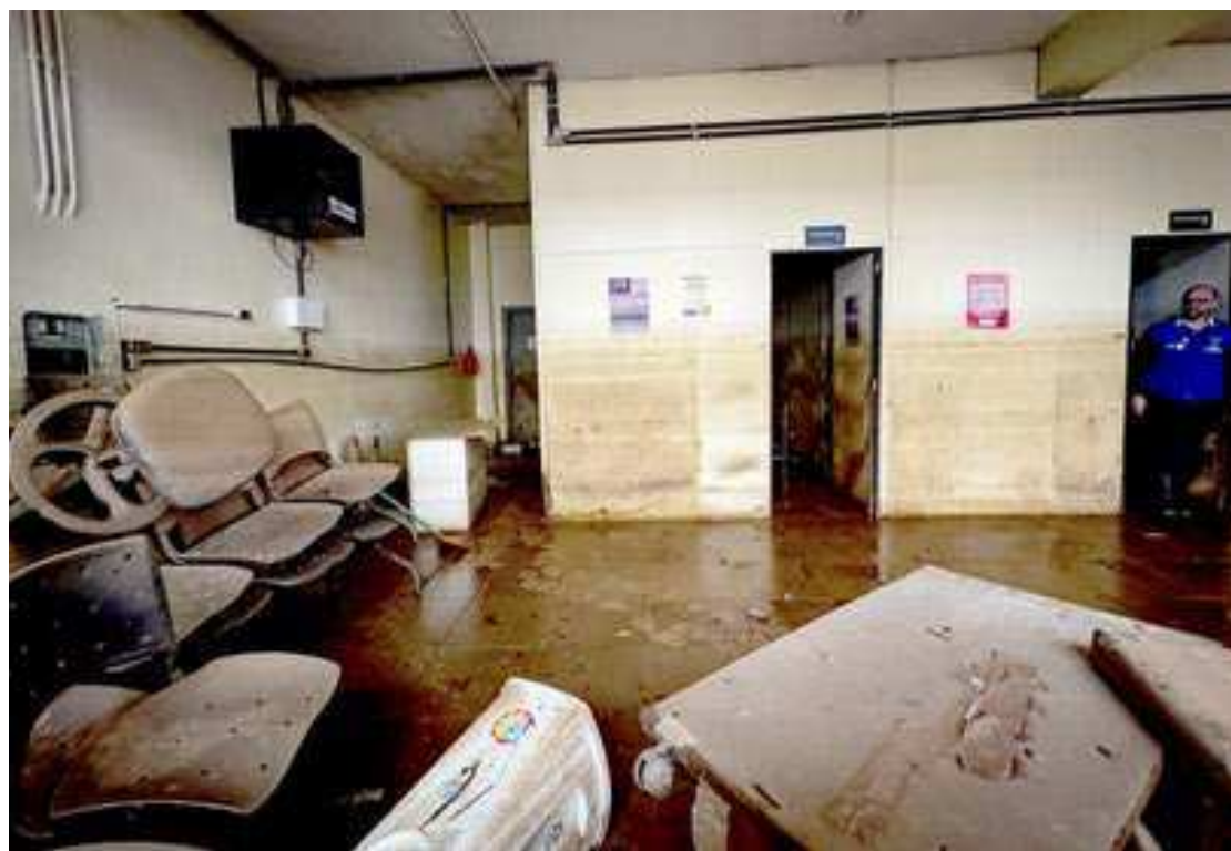
A chuva acumulada em Porto Alegre neste mês alcançou a marca de 513,6 mm na segunda-feira

No feriado de Corpus Christi, o tempo continua firme e muito frio, apesar do sol. O risco de geada aumenta na Serra gaúcha e o dia pode começar com névoa em Porto Alegre.