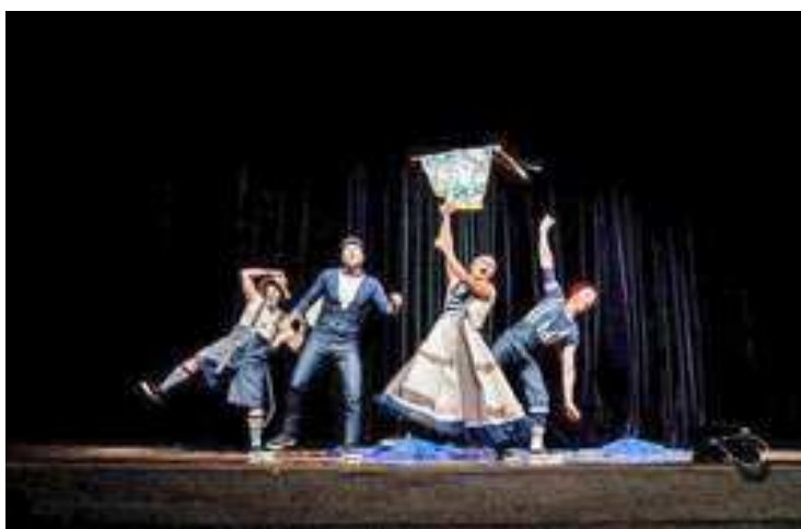
Antecipando esta quarta-feira (5), na qual se comemora o Dia Mundial do Meio Ambiente, os artistas falaram sobre a turnê