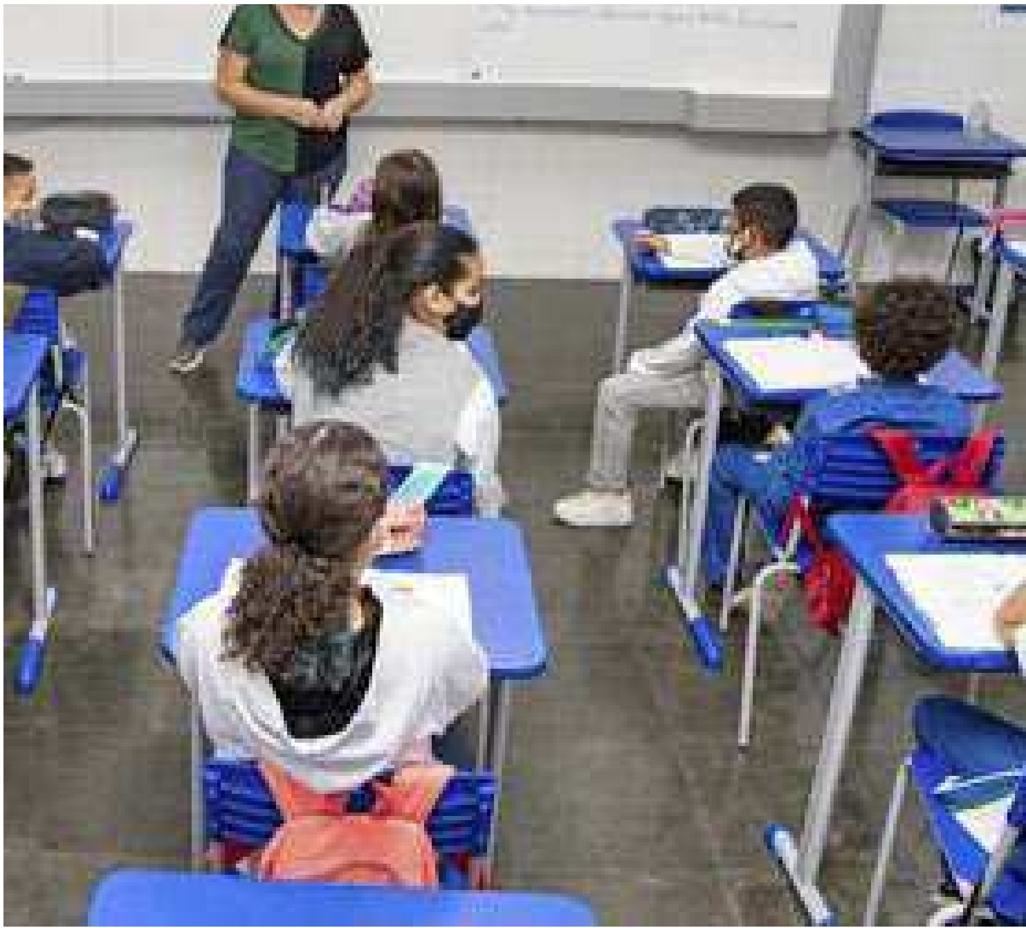
A Seduc-Sp afirma que a promoção de políticas inclusivas e o apoio sistemático aos alunos da educação especial são compromissos

A bancária Fabiana Silva tem duas filhas gêmeas, mas só A