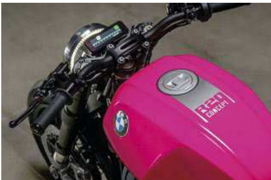
O tanque protuberante e expressivo é uma escultura, com a traseira reduzida ao máximo para enfatizar as linhas limpas da motocicleta

O farol de leds é apresentado na forma de um anel de alumínio impresso em 3D com luz de circulação diurna integrada, com o principal parecendo flutuar no meio desse anel de luz de circulação diurna. A lanterna está integrada ao assento único, estofado com Alcantara preto acolchoado e couro de grão fino, enfatizando a aparência dinâmica de roadster com sua traseira compacta. O eixo de transmissão exposto - um destaque visual dos modelos R18 - foi encurtado para integração na arquitetura da R20. Os componentes Öhlins Blackline ajustáveis estão nas suspensões dianteira e traseira. As pinças de freio têm seis pistões na frente e quatro atrás. O sistema de escapamento dois em dois completa o design. (Edmundo Dantas/ AutoMotrix)