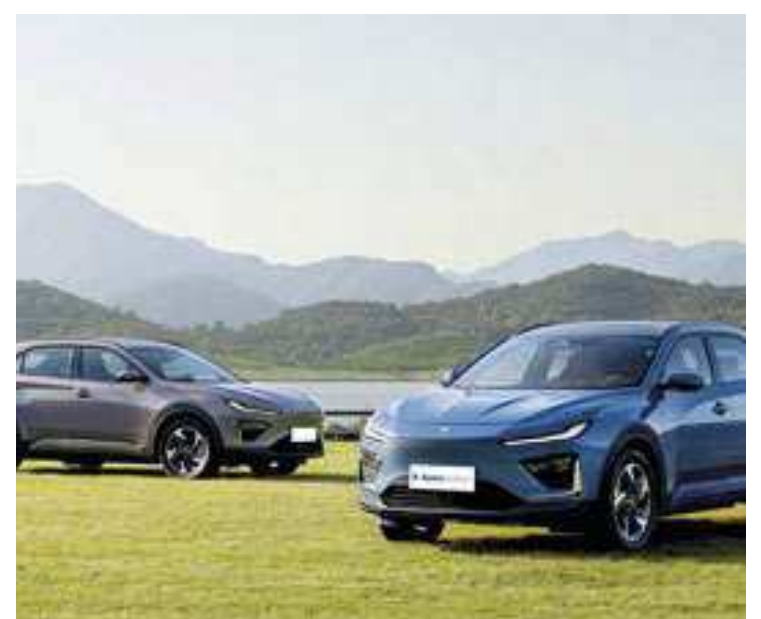
O Neta X é totalmente elétrico, menor em comparação ao L

"Tecnologia para todos" e "oferecer veículos elétricos inteligentes acessíveis". É com esses dois mantras que a Neta Auto desembarca no Brasil. Os objetivos são bastante ousados: ser referência entre os veículos elétricos, mantendo-se desenvolvida, atualizada e com produtos modernos. O nome "Neta" está associado a uma lenda chinesa. Basicamente, ela conta a história de um menino que nunca desiste dos seus sonhos. Segundo Henrique Sampaio, diretor de Marketing e Produto da Neta Auto, o próprio logotipo da nova fabricante mistura os significados de pessoas, árvores, primavera e asas, para retratar uma empresa que materializa sonhos. "O espírito Neta representa uma nova tentativa e exploração da cultura tradicional chinesa na nova era, um compromisso sincero com o valor da tecnologia para todos, sem-