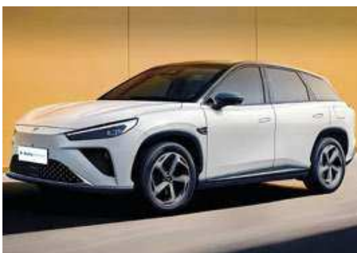
Outro modelo cotado para o Brasil é o Neta L, o SUV médio conta com uma variante 100% elétrica e autonomia de 460 quilômetros

sumir a fábrica da Toyota em Indaiatuba (SP) - a gigante japonesa decidiu concentrar sua produção no Brasil na unidade industrial de Sorocaba (SP). Se a Neta realmente ocupar a unidade que era da Toyota, produzirá carros, em um primeiro momento, sob o regime CKD, com partes vindas da China.