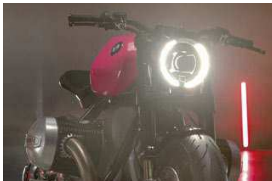
O conceito BMW R20 é uma obra de arte sobre duas rodas exposta no Concorso d'Eleganza Villa d'Este, na Itália