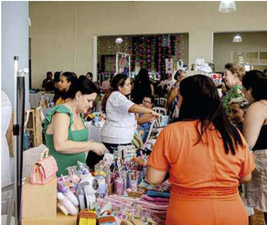
Nesta edição, a Expo vai se destacar pela diversidade de produtos e serviços oferecidos