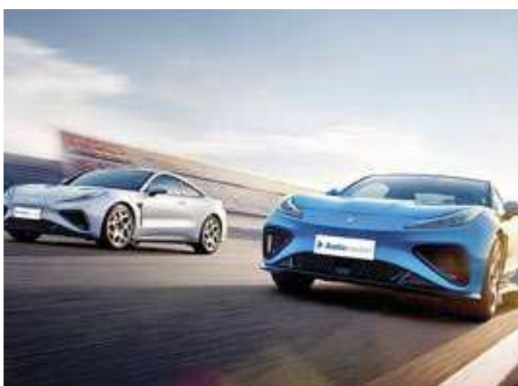
O Neta GT chegará para brigar diretamente com o BYD Seal

» O mundo do automóvel elétrico está cada vez mais dominado pelos chineses. E a principal estratégia dos dirigentes das marcas automotivas para a China chegar à supremacia foi quando, com o apoio governamental, decidiram se especializar em carros carregáveis em tomadas. Além de ter uma mão de obra mais barata, que ajuda a manter os produtos feitos no país asiático com preços mais acessíveis, as marcas chinesas assumiram o comando de fabricantes europeias instaladas na China ou se associaram com elas, com foco na importação de tecnologia para seus próprios veículos. A BYD já tomou conta do universo elétrico do mercado brasileiro, puxando a GWM, a Seres, a Chery e desde o final do ano passado, a nova associação da Omoda com a Jaecoo. Agora, a novata Neta Auto - fundada em 2018 e pertencente ao grupo Hozon New Energy Automobile (um gigante fornecedor global de tecnologia) - anuncia sua chegada ao Brasil, já para este ano. Trará modelos feitos na China e promete construir em breve uma fábrica para produzir em território nacional. Para isso, uma das possibilidades da Neta seria as-