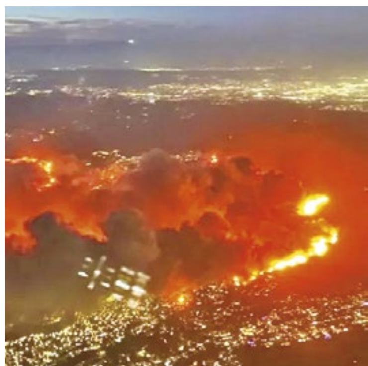
Los Angeles têm outros dois focos de incêndios maiores a leste e oeste de Hollywood, em Pacific Palisades e Altadena

As chamas que atingem a cidade desde a terça-feira (7) resultaram, até agora, em cinco