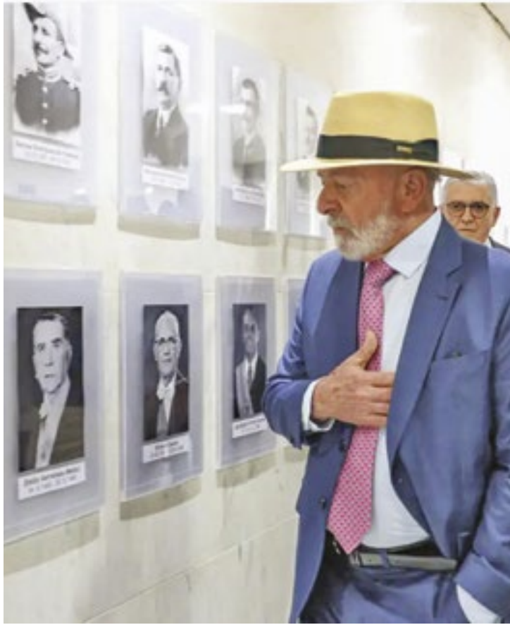
Até o momento, a nova política de moderação da Meta vale para os EUA, mas deverá se estender para outros países

Até o momento, a nova política de moderação da Meta vale para os EUA, mas deverá se estender para outros países.