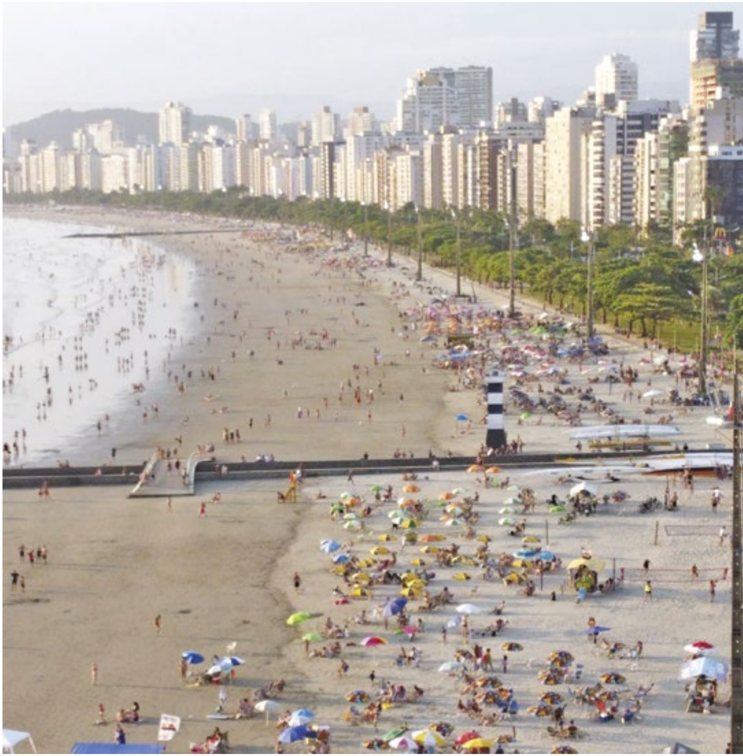
Vista aérea da Orla de Santos: índice FipeZap apontou que o preço médio do metro quadrado fechou 2024 valendo R$ 7.322,00

"Em Santos, tivemos o fenômeno do pré-sal, que chamou muita atenção, e foram