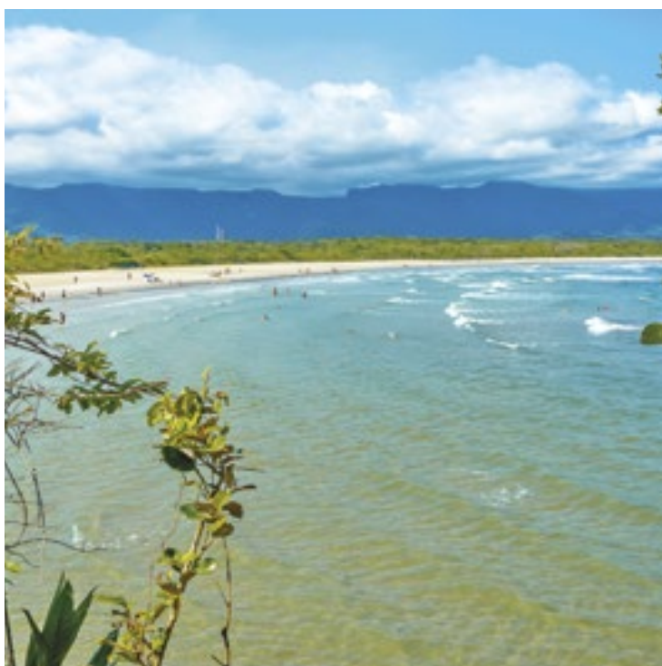
Bertioga é uma das únicas do litoral paulista com todas as praias aprovadas pela Companhia Ambiental do Estado de São Paulo

O boletim da Agência do Governo do Estado de São Paulo analisa praias em 15 cidades em todo o litoral paulista. Em