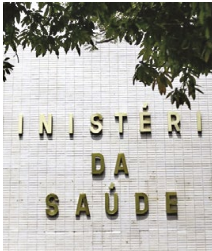
As últimas atualizações mostram que a intensidade das infecções respiratórias diminuiu nas últimas semanas

A pasta voltou a incentivar a vacinação como medida preventiva para infecções respiratórias, incluindo a covid-19 e a gripe ou influenza – sobretudo entre grupos considerados prioritários, como idosos e gestantes. (AB)