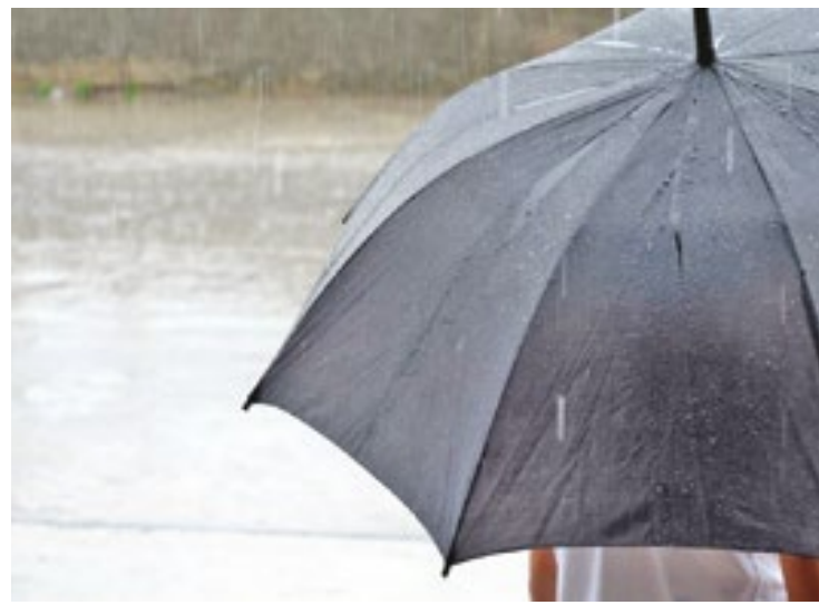
Chuvas vão ser intensas no estado de SP até domingo (4)

O fenômeno meteorológico, caracterizado por chuvas persistentes e volumosas, eleva os ris-