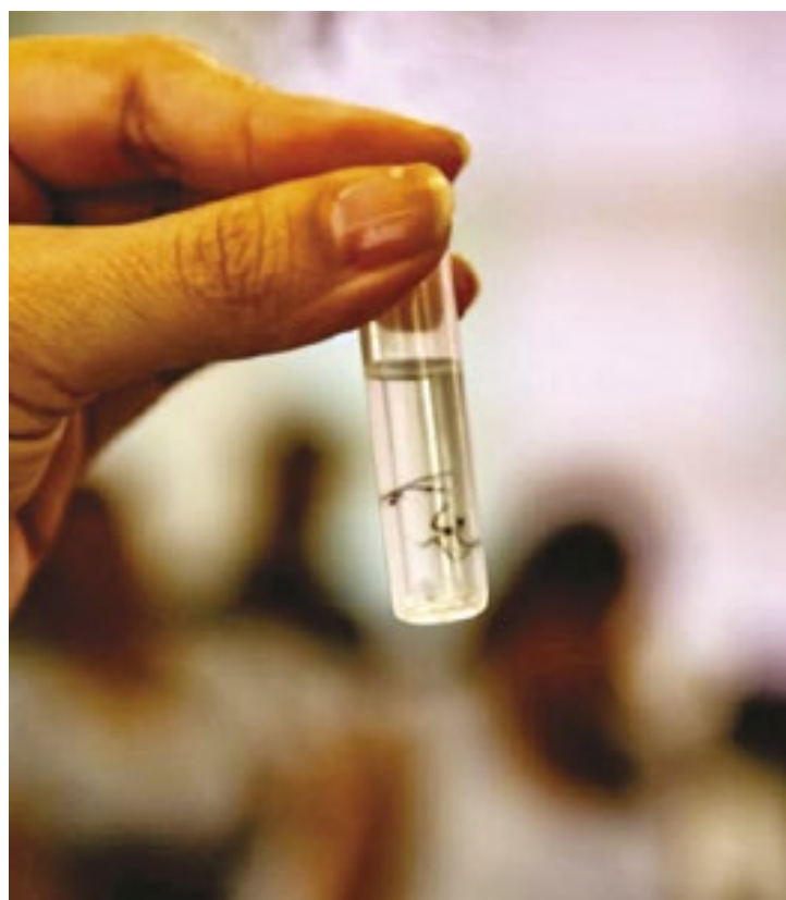
Campanha 'Com a Dengue Não Se Brinca' começa neste sábado nos bairros do Parque Pinheiros e Jardim Trianon

Ele alertou que a dengue pode levar a complicações muito sérias. "Cabe a nós, governo, trabalhar para evitar que isso aconteça. E o lançamento desta campanha é uma ferramenta importante para acabar com o mosquito da dengue. Mas, volto a afirmar, precisamos trabalhar juntos, cada um fazendo a sua parte. A população pode ter certeza que estamos empenhados em ajudar a eliminar todo e qualquer foco da dengue".