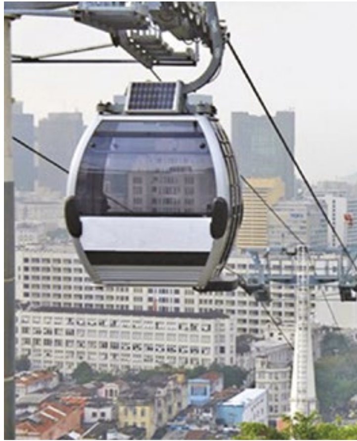
As linhas devem ser implantadas em áreas de grande densidade populacional e fazer conexão com pontos de ônibus, estações de metrô e de trem

Uma proposta semelhante foi apresentada pelo então candidato Pablo Marçal (PRTB) durante a campanha para a Prefeitura de São Paulo no ano