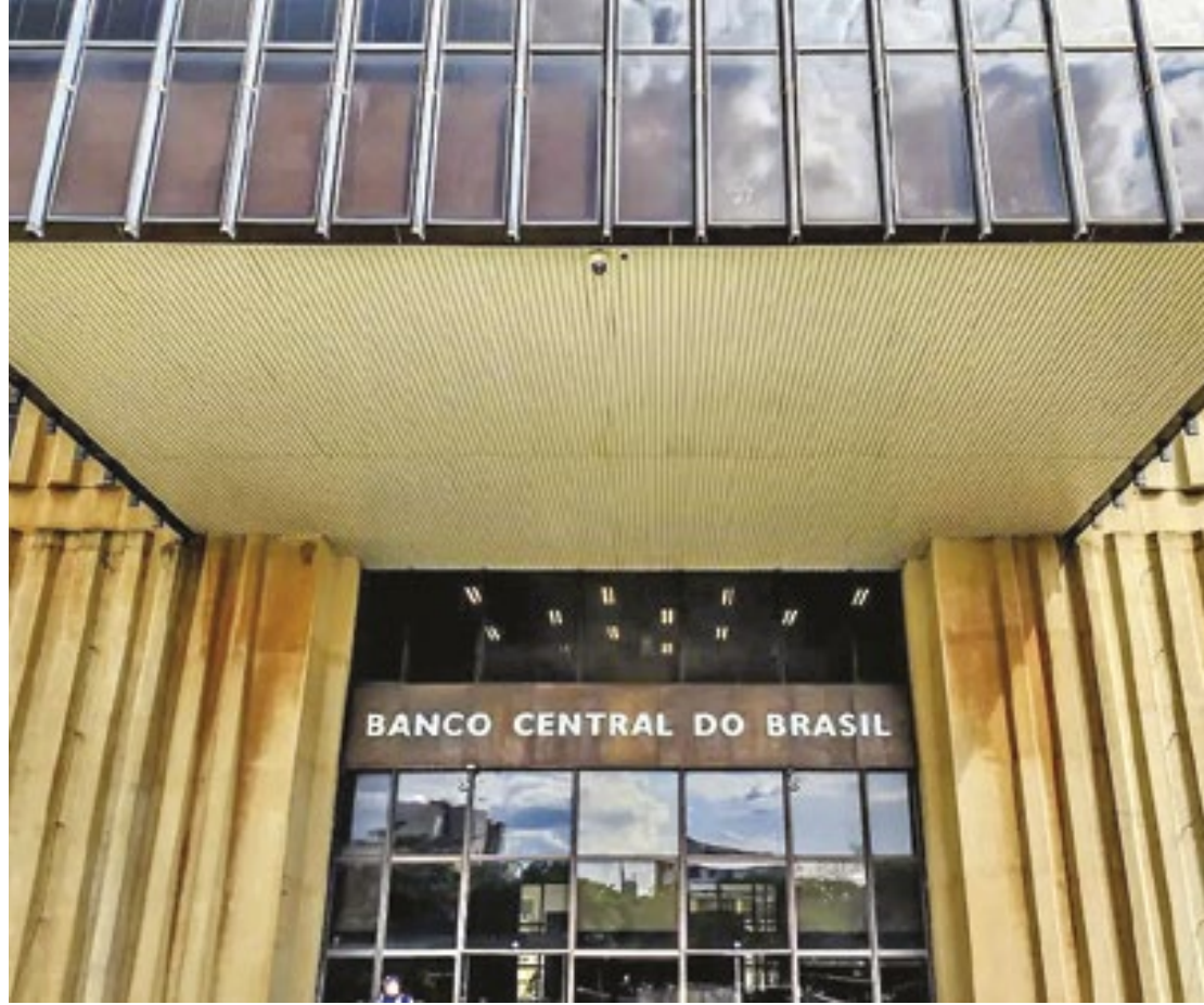
RAFAEL NEDDERMEYER/AGÊNCIA BRASIL

Essa foi a quarta alta seguida da Selic; taxa está no maior nível desde setembro de 2023