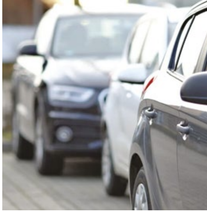
Segundo a Lei 13.478/02, um carro é considerado abandonado quando está estacionado em via pública por mais de cinco dias

Caso o veículo não seja pago, a fiscalização aplica uma Tarifa Pós-Utilização