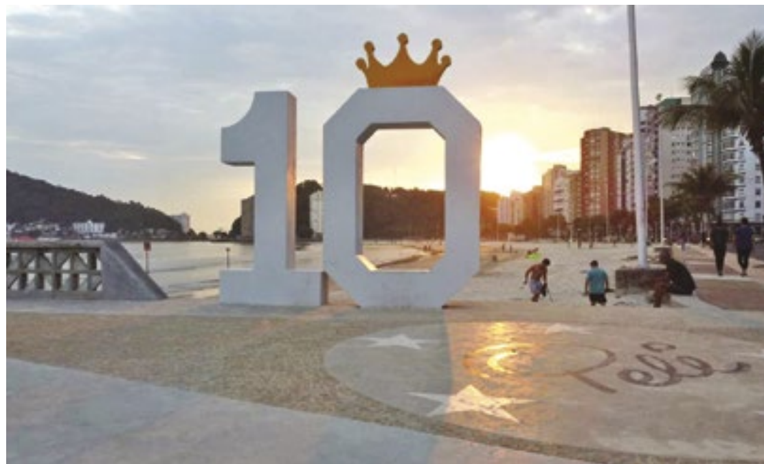
Com a combinação perfeita de mar, praia e montanhas, São Vicente é o local ideal para quem deseja se conectar com a natureza ou se divertir ao máximo com toda a família

O Píer do Pelé, localizado na orla do Gonzaguinha, se tornou um atrativo turístico mundial, com visitas de grandes astros do esporte. O local oferece uma vista inigualável e conta com uma escultura de Pelé, eternizando seu icônico ‘soco no ar’, marca registrada do atleta do século em suas comemorações após cada gol. Idealizado pelo prefeito Kayo Amado, santista apaixonado, o atrativo surgiu com a finalidade de perpetuar a imagem do maior expoente da história do fu-