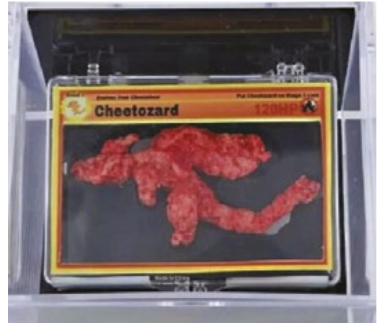
Em uma caixa, o Cheetos de 7 cm de comprimento, no formato do personagem Charizard, é afixado em um cartão Pokémon personalizado

Os lances pelo salgadinho começaram em US$ 250 (cerca de R$ 1,4 mil) em meados de fevereiro e rapidamente subiram para os cinco dígitos superiores. (Yasmin Gomes)