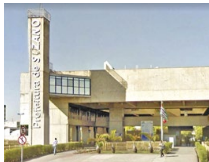
GOOGLE STREET VIEW

Os interessados podem se inscrever exclusivamente pela internet, até o dia 3 de abril, as 23h59, no site do Nosso Rumo