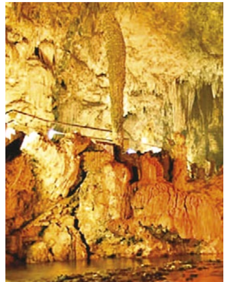
O nome do livro em questão é "Blecaute", publicado pela primeira vez em 1986. Ele é do tipo romance apocalíptico

Feliz Ano Velho (1982), Uabrari (1990), Bala na Agulha (1992), As Fêmeas (1994), Não És Tu, Brasil (1996), Malu de Bicicleta (2002), O Homem que Conhecia as Mulheres (2006), A Segunda Vez que Te Conheci (2008), Marcelo Rubens Paiva - Crônicas para Ler na Escola (2011), 1 dribble, 2 dribbles, 3 dribbles: manual do pequeno craque cidadão (2014), Meninos em Fúria (2016), O Orangotango Marxista (2018), O Homem Ridículo (2019), Do Começo ao Fim (2022) e diversas peças de teatro. (Márcio Ribeiro)