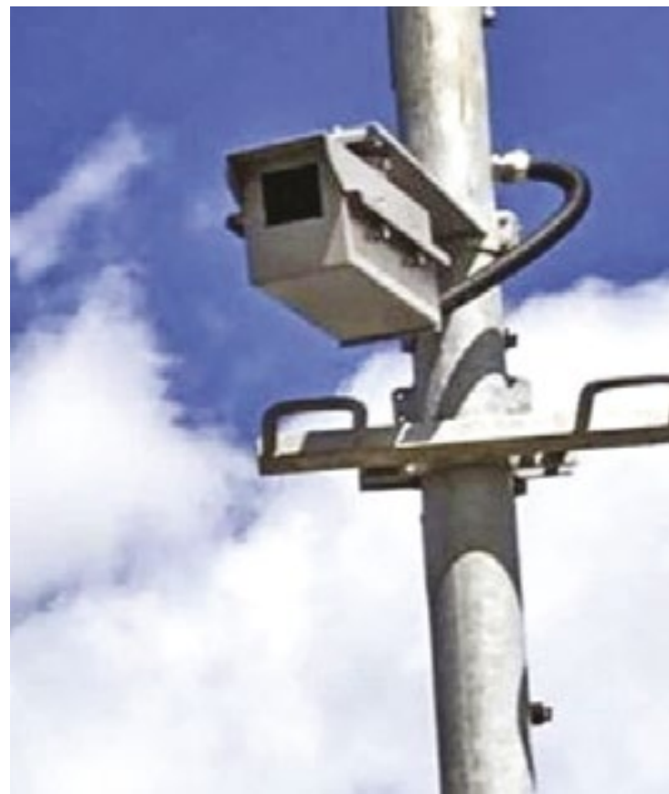
As câmeras ainda podem oferecer o recurso de reconhecimento facial, pelos quais podem identificar as pessoas captadas

Durante as festividades carnavalescas, as câmeras também trabalharão para monitorar potenciais perigos, como brigas generalizadas ou atos de vandalismo contra veículos estacionados.