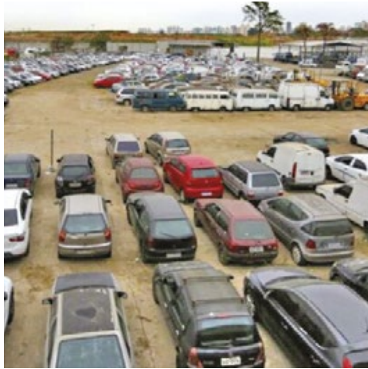
Entre as melhores ofertas estão um Chevrolet Corsa, ano 2000, a R$ 900, um Fiat Siena, anos 2018, a R$ 1,3 mil e um HB20, ano 2014, a R$ 2,2 mil

Os lotes oferecidos no leilão podem ser conferidos de perto entre os dias 17 e 21 de mar-