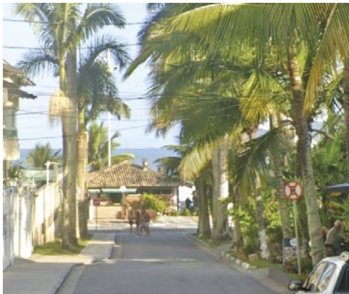
O STJ confirmou o fechamento da Rua Nicolau Lopes, na Praia do Tombo, ao tráfego de veículos

O município ainda tentou levar o caso ao Supremo Tribunal Federal (STF), mas o recurso não foi admitido, encerrando qualquer possibilidade de nova contestação.