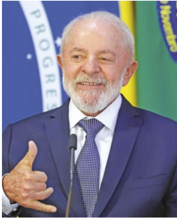
Lula assinou ontem Projeto de Lei que prevê isenção de Imposto de Renda (IR) para pessoas que recebem até R$ 5 mil por mês

A cobrança extra mira contribuintes que têm seus rendi-