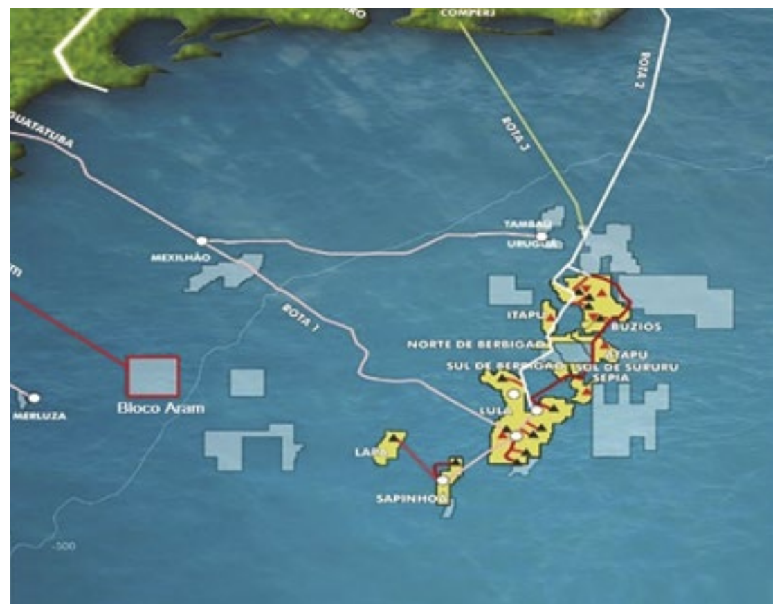
O poço 4-está situado na reta de Santos, a 245 km da costa e sua profundidade é de 1.759 metros

Hidrocarbonetos são compostos orgânicos formados por átomos de carbono e hidrogênio, que são utilizados como combustíveis e matéria-prima. Leia o texto completo no site do DL. (Nilson Regalado e Pedro Henrique Fonseca)