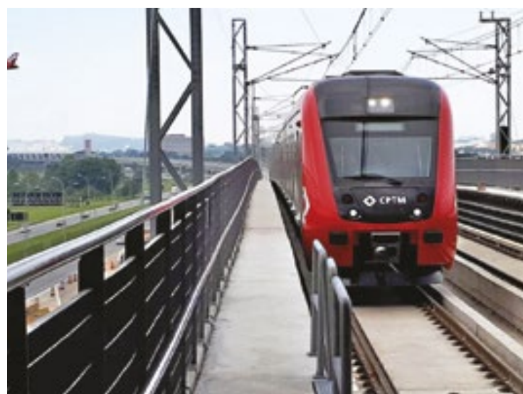
Expresso aeroporto CPTM muda rota por conta de obras na Capital

Durante todo esse período, a operação assistida entre Palmeiras-Barra Funda e Estudantes, que ocorre todos os domingos das 10h às 15h, será suspensa.