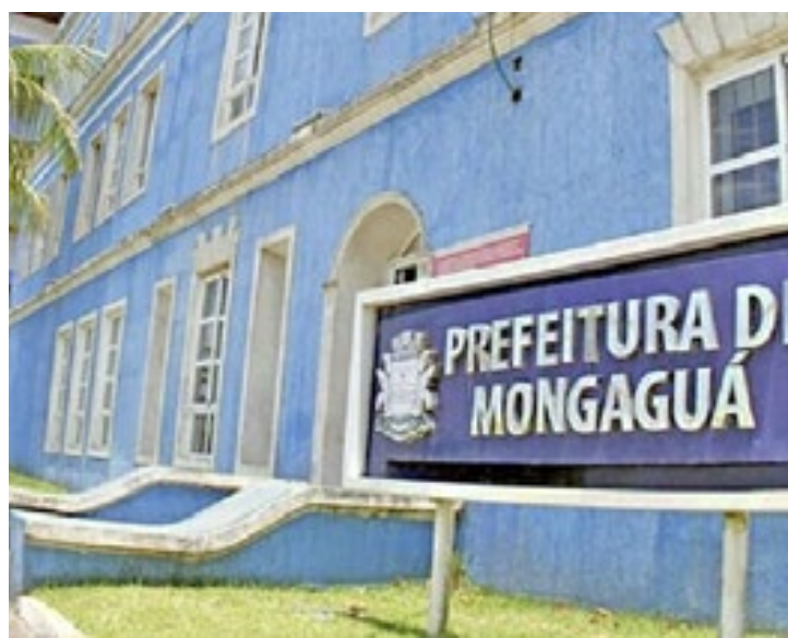
A cidade de Mongaguá terá novas eleições para prefeito

Paulinho ficou em primeiro lugar no primeiro turno, com 42,47% dos votos válidos. Mas ele disputou a eleição, em 6 de outubro de 2024,