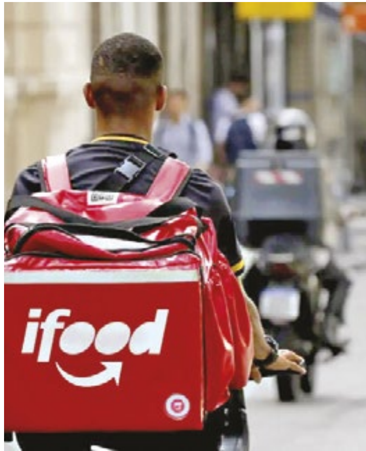
Tarcísio de Freitas (Republicanos) sancionou lei que cria um cadastro de identificação de entregadores