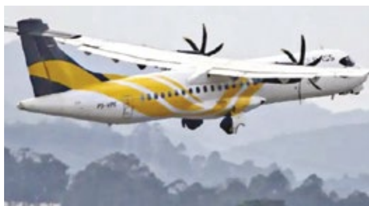
Anac informou, após nova rodada de auditorias, que identificou a “degradação da eficiência do sistema de gestão da empresa”

A Voepass possui seis aeronaves. A operação da companhia incluía 15 localidades com voos comerciais e duas com contratos de fretamento, sendo