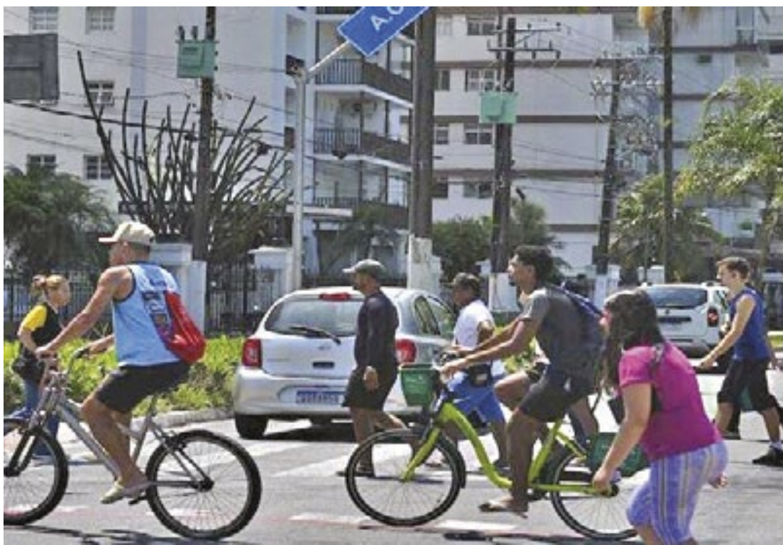
Valor médio das dívidas dos santistas chega a R$ 6.971,27, equivalente a 4 salários-mínimos

Para ajudar a reverter essa situação, a especialista deixa 7 dicas aos consumidores da cidade: anote todas as suas dívidas; relacione valores (to-