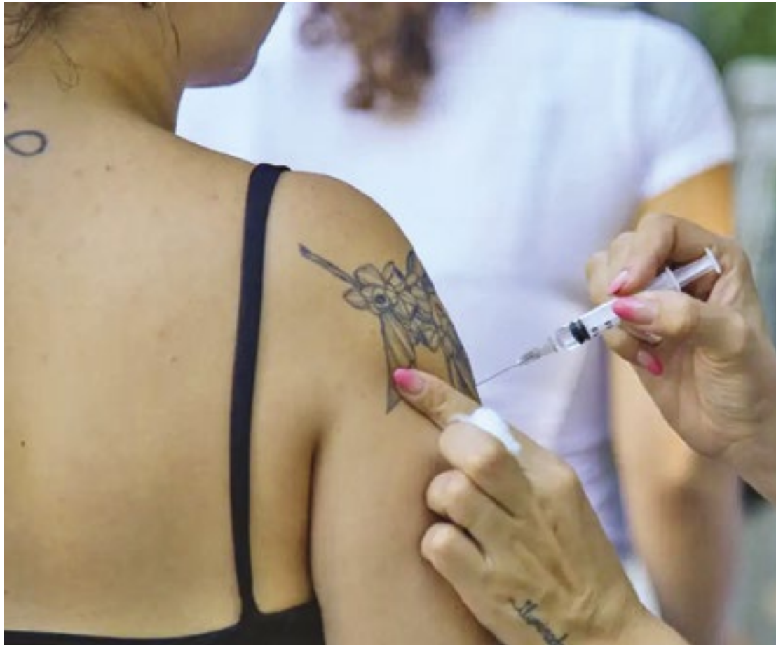
Vacinação contra a gripe será intensificada no estado de SP após abril; veja como se imunizar

Na última sexta-feira (21/3), a Secretaria de Estado da Saúde recebeu 1 milhão de doses da vacina contra influenza do Ministério da Saúde. Os imunizantes serão enviados ainda nesta semana aos Grupos de Vigilância Epidemiológica, que farão a distribuição aos municípios. (Isabela Alves)