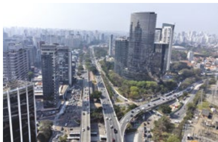
Nesta terça-feira (25), o dia será marcado pelo sol entre muitas nuvens em todo o Estado de São Paulo; confira previsão

variam entre 19°C e 28°C. Já para região de Botucatu, os termômetros variam entre 19°C e 30°C.