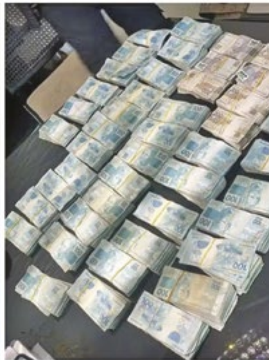
Operação contra quadrilha de roubo de carga foi realizada ontem; carros de luxo foram apreendidos

tima quarta-feira (19/3), dois homens foram presos após tentar roubar carga e fazer reféns.