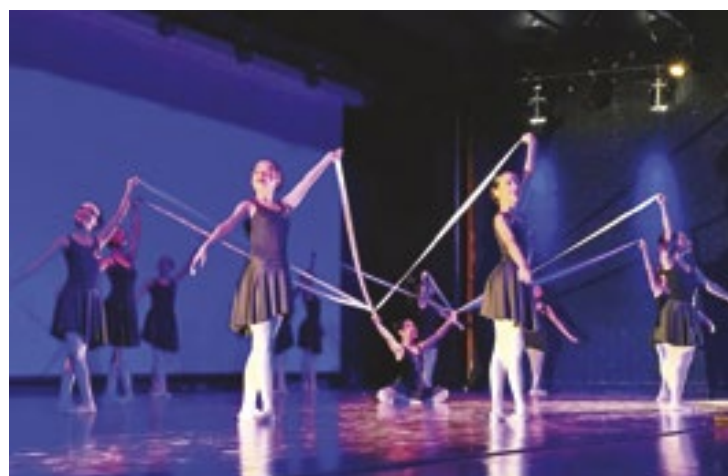
Pareceristas desempenham papel fundamental na seleção de projetos culturais que buscam financiamento do Governo Federal

Para se candidatar, são critérios obrigatórios ter conhecimento e atuar nas áreas artística e cultural, além de possuir experiência anterior na avaliação de projetos culturais, tudo isso comprovado por meio de notas fiscais, recibos ou declarações institucionais. É neces-