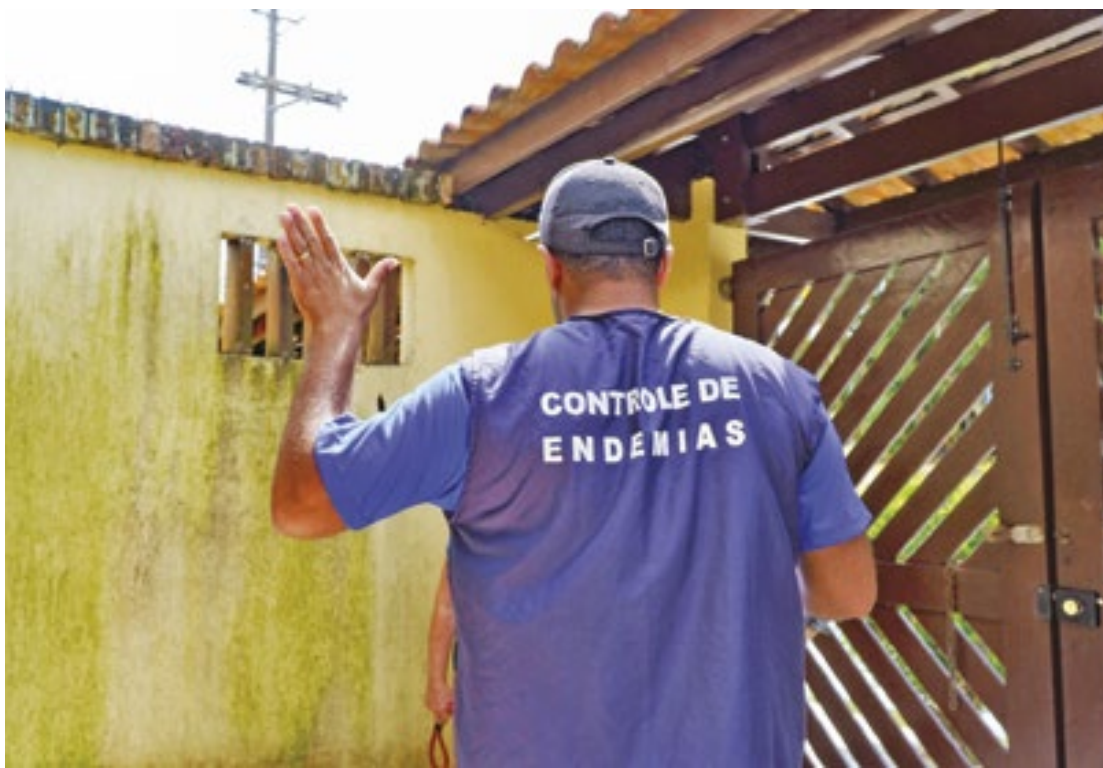
Queda é resultado de um conjunto de ações intensivas de combate ao mosquito, apontou a prefeitura

Um dos principais aliados no sucesso das ações