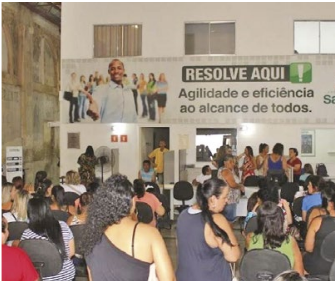
O cadastro para as entrevistas é obrigatório e já está disponível no Resolve Aqui

“Decidimos dedicar esta edição reforçando nosso compromisso em ampliar as oportunidades para o público feminino. Serão 100 vagas exclusivas, um número significativo que pode transformar vidas e contribuir para a independência financeira de muitas mulheres”, disse o secretário. (DL)