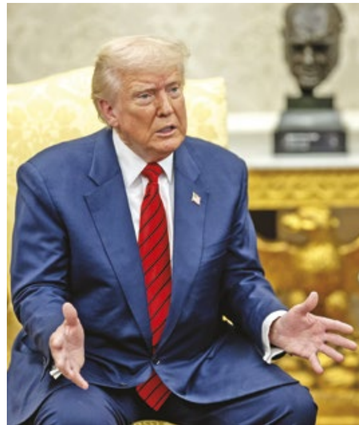
O presidente dos Estados Unidos, Donald Trump:

O decreto permite que os departamentos de Segurança Interna, de Estado e a Administração da Segurança Social forneçam acesso a bancos de dados federais aos estados para checar a cidadania dos eleitores. Trump mencionou a necessidade de confirmação da cidadania, através de passaporte americano, documento de identidade válido ou identificação militar.