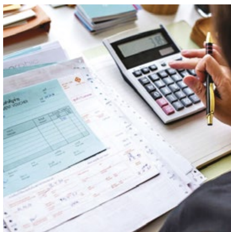
Segundo um estudo da CDL Santos Praia, o índice de débitos em atraso aumentou 0,79% em fevereiro de 2025

Na contramão dessa tendência, a região Sudeste apresentou uma redução na inadimplência de 0,40%, assim como a média nacional, que teve uma leve queda de 0,04%. Para compilar esses dados, a análise verificou a quantidade de débitos e de