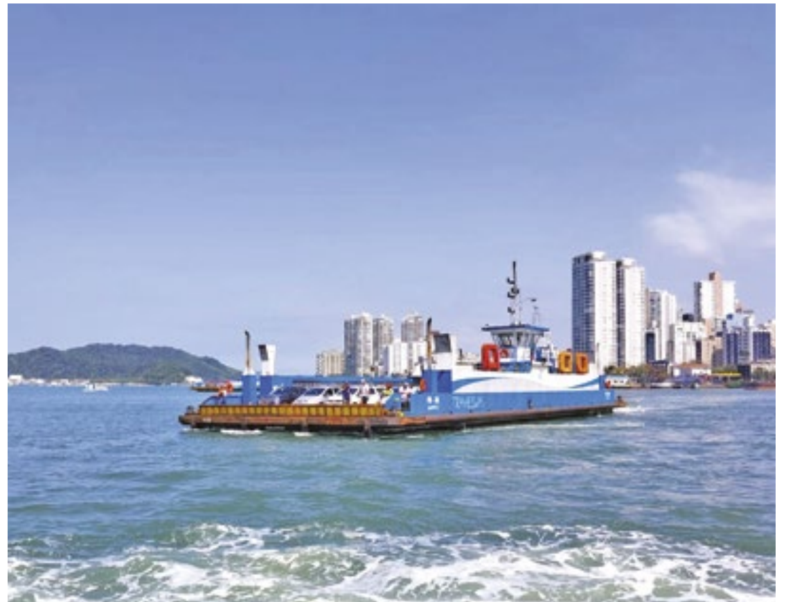
ARNAUD PIERRE COURTADON/DL

O modelo de concessão deve manter a política tarifária atual, sem previsão de reajuste nos valores cobrados e com a manutenção das gratuidades existentes. Para isso, o Estado vai arcar com