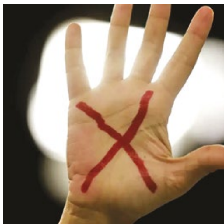
Brasil registrou 196 estupros por dia, em 2024, o que totalizou 71.892 casos de estupro de mulheres em todo o ano passado

Ainda sobre formas de violência contra as mulheres, o relatório anual mostra que o Brasil registrou o equivalente a 196 estupros por dia, em