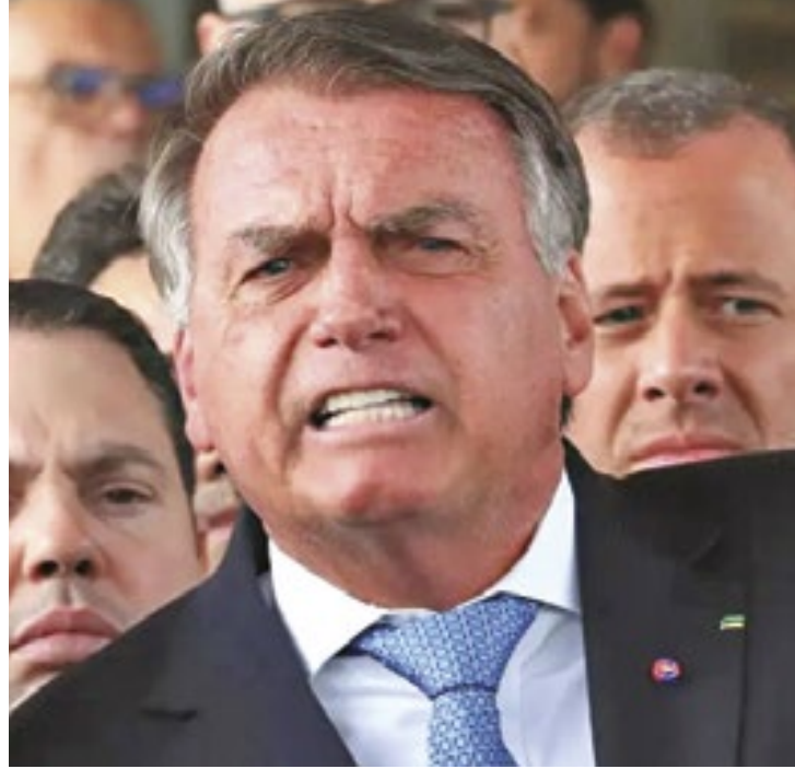
Em entrevista, ele voltou a atacar ontem o ministro Alexandre de Moraes e o sistema eleitoral, e defendeu o voto impresso

Os ministros também decidiram, por unanimidade, tornar mais sete aliados de Bolsonaro réus na mesma ação penal. Eles responderão pelos mesmos crimes imputados ao