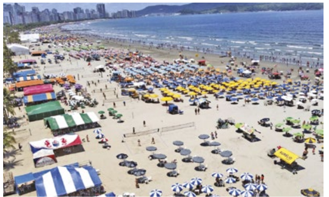
Os dados são baseados em levantamento da Ecovias, concessionária do Sistema Anchieta-Imigrantes

Aliás, foi registrado incremento de visitantes nos equipamentos turísticos. Durante