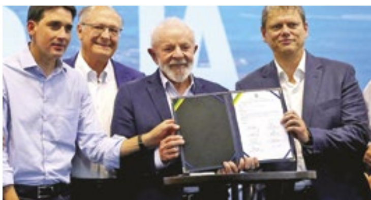
Em visita ao município, Lula prometeu instalar um instituto