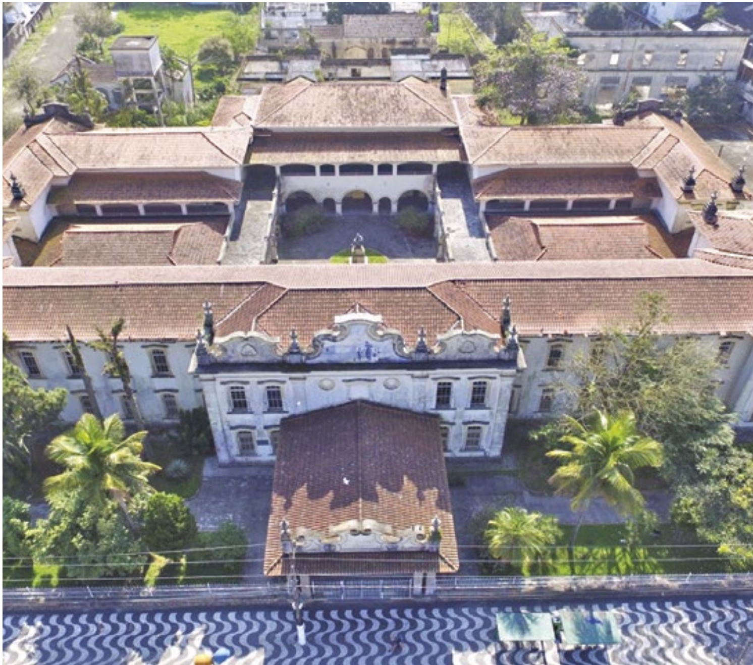
Orçado inicialmente em R$ 50 milhões, projeto de recuperação das características originais custaria, hoje, R$ 77 milhões