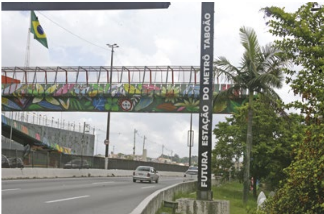
Projeção do governo estadual é entregar a estação em Taboão da Serra, em 2028

“A gente vai iniciar a demolição de um prédio onde será instalada a futura estação de Metrô. Em conversa com o governador, com a equipe responsável, o com-