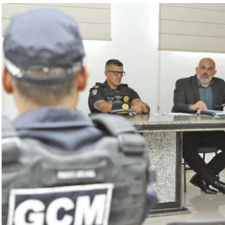
Autoridades do setor discutiram propostas para estreitar ações conjuntas, com o objetivo de tornar a Cidade mais segura

Foi definido que as reuniões serão realizadas sempre às primeiras terças-feiras do mês (exceto feriados), na Câmara Municipal, a partir das 14h. Sugestões, ideias e debates referentes à segurança serão discutidas em conjunto entre o poder público e municípios. Estiveram presentes representantes da Secretaria de Defesa