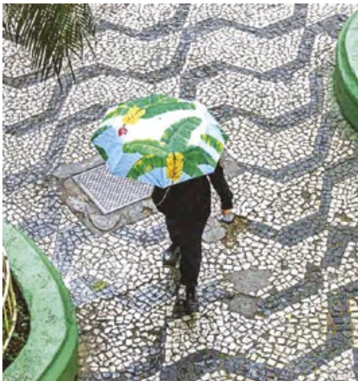
Frente fria chegará forte nessa primeira semana de abril

Hoje haverá sol na maior parte do tempo com algumas nuvens no céu. Não chove. As máximas sobem um pouco e chegam aos 33° C, com a sensação térmica indo aos 35° C. (Jefferson Marques)