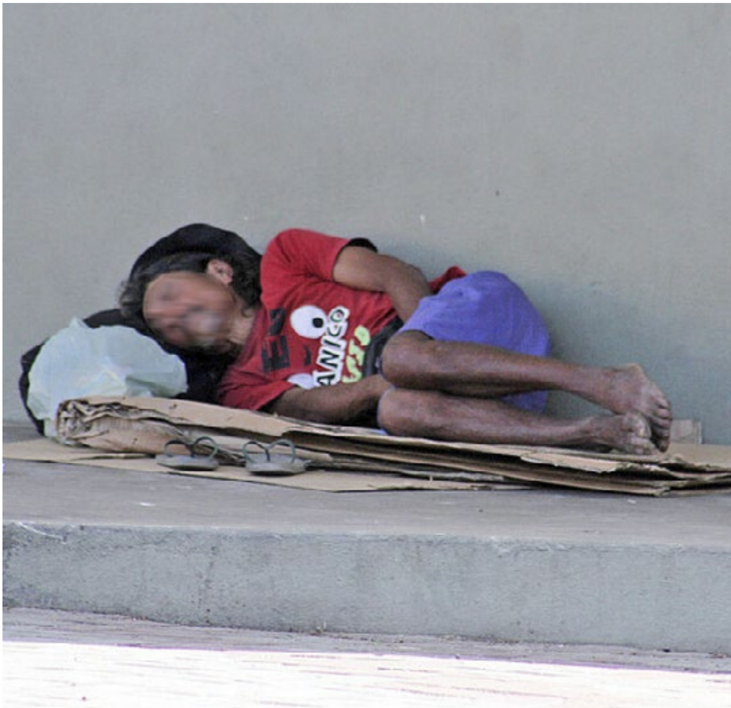
Agentes da Força Delegada abordam as pessoas em situação de rua e retiram o papelão que as protege da umidade do chão

A equipe age de madrugada para não chamar a atenção da opinião pública. As abordagens possuem características higienistas. Não tem qualquer objetivo social, pois os agentes não fazem atendimento ou dão orientação para que as pessoas procurem um dos abrigos oferecidos pela SEDS. Também é usado um caminhão para jogar os pertences dos abordados,