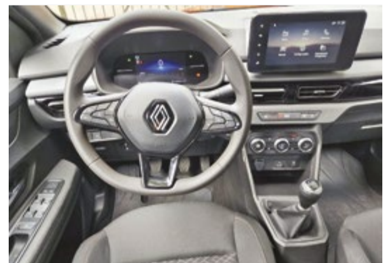
Segurança: os principais itens de série são os seis airbags, o assistente de partida em rampa e o controle de estabilidade

o, destaque para o ar-condicionado digital com função auto, os retrovisores externos com ajuste elétrico, os cintos de segurança dianteiros com ajuste de altura e