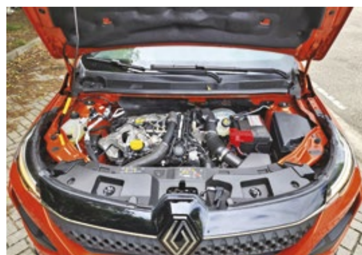
Kardian Evolution MT traz o mesmo motor TCE 1.0 do restante da linha – turbo flex de 3 cilindros com duplo comando variável

O Kardian Evolution MT traz o mesmo motor TCE 1.0 do restante da linha – um turbo flex de três cilindros com duplo comando variável e injeção direta que rende 120/125 cavalos e 20,4/22,4 kgfm com gasolina/etanol. Produzido no Paraná pela Horse – empresa do Renault Group –, o motor triclíndrico de 1,0 litro é uma derivação do tetracilíndrico 1.3 turbo (H5HT) usado no Duster e na picape Oroch, com um cilindro a menos. O câmbio é o JX22 manual com 6 marchas com embreagem a seco. A não ser pela troca do câmbio automatizado de dupla embreagem pelo manual, pelos “paddles shifters” (presentes apenas nas variantes com transmissão automatizada de dupla embreagem) e pelo pedal de embreagem (exclusivo