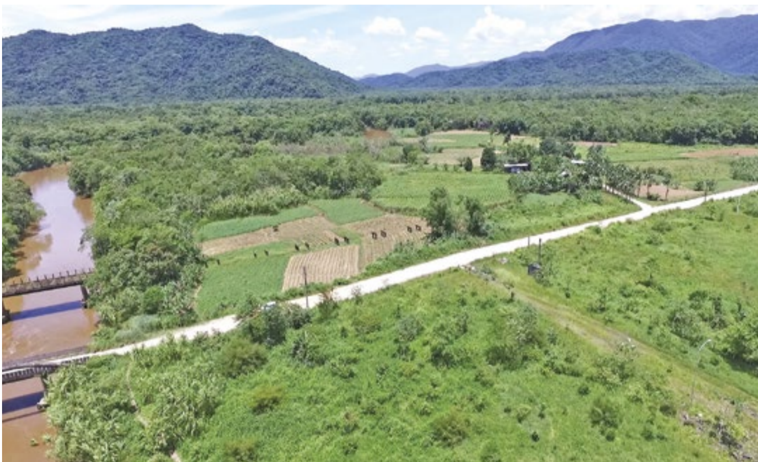
Rodovia Parelheiros-Itanhaém ligaria a capital ao Litoral Sul em apenas 30 minutos e desafogaria o Sistema Anchieta-Imigrantes

O Governo do Estado não avançou sequer um metro na concretização da SP-040. Em julho de 2024, o Departamento de Estradas de Rodagem (DER) revelou com exclusividade ao Diário do Litoral que retomaria os estudos de viabilidade da rodovia, conhecida como Parelheiros-Itanhaém. Na ocasião, o DER, afirmou que sua Diretoria de Engenharia faria uma atualização das informações