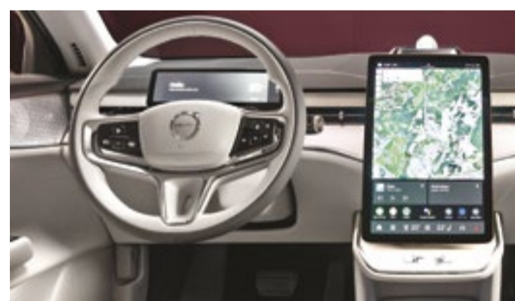
Sistema de entretenimento e conectividade é alimentado pela Cockpit da Qualcomm, com Google Maps, Google Assistant

O ES90 tem os tradicionais faróis com estilo "Martelo de Thor" e conjunto de lanternas em formato de "C" voltado para dentro e duas faixas