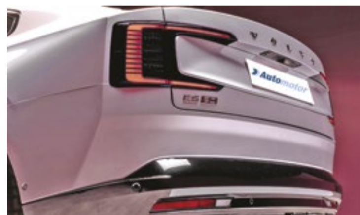
ES90 tem os tradicionais faróis com estilo "Martelo de Thor"

verticais nas laterais do vidro traseiro, com sete opções de cores externas e rodas de 20 a 22 polegadas. O interior, com design minimalista e sóbrio, a exemplo do recentemente lançado SUV elétrico EX90, tem espaço de sobra para cinco adultos – não importando a estatura do ocupante –, central multimídia "touchscreen" de 14,5 polegadas no sentido vertical, outra tela de 9 polegadas para o motorista e "head-up display" com pro-