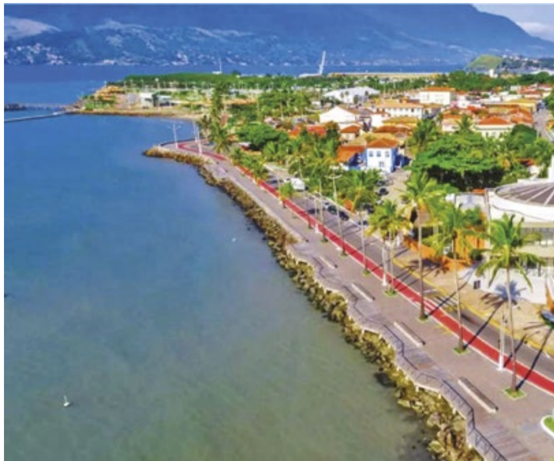
Cidade de São Sebastião, no litoral norte de São Paulo, conta com uma programação especial

A abertura do evento será com o DJ Dani Turtles, seguida pela apresentação de João Porca Duo e, para encerrar, o show da banda Soul Clean. (Yasmin Gomes)