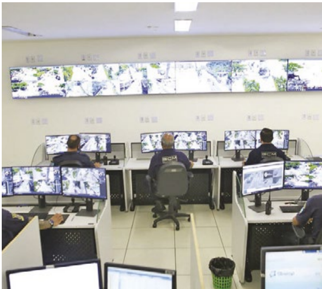
Há estudos em andamento para modernizar o sistema de segurança com o uso de IA

“Infelizmente, a gestão anterior não tinha previsão de investimento em tecnologia de monitoramento. Entretanto, colocaremos essa demanda entre nossas principais metas na elaboração do orçamento de 2026. O prefeito Farid Madi almeja transformar Guarujá em uma cidade mais sustentável e inteligente”, completa. (GSP)