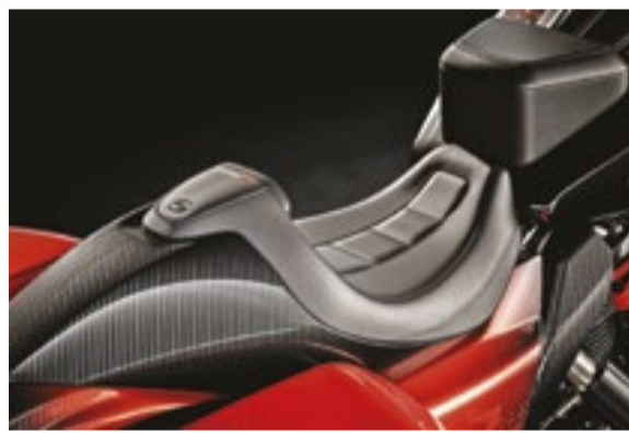
CVO Road Glide RR ostenta a cor sólida Racing Oage, se espalhando em uma sequência de barras