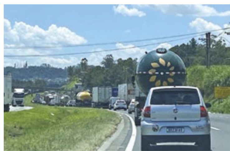
Trânsito na rodovia Régis Bittencourt (BR-116) é alvo de reclamações por parte das prefeituras da região sudoeste da Grande São Paulo

Com a presidência do prefeito de São Lourenço da Serra,