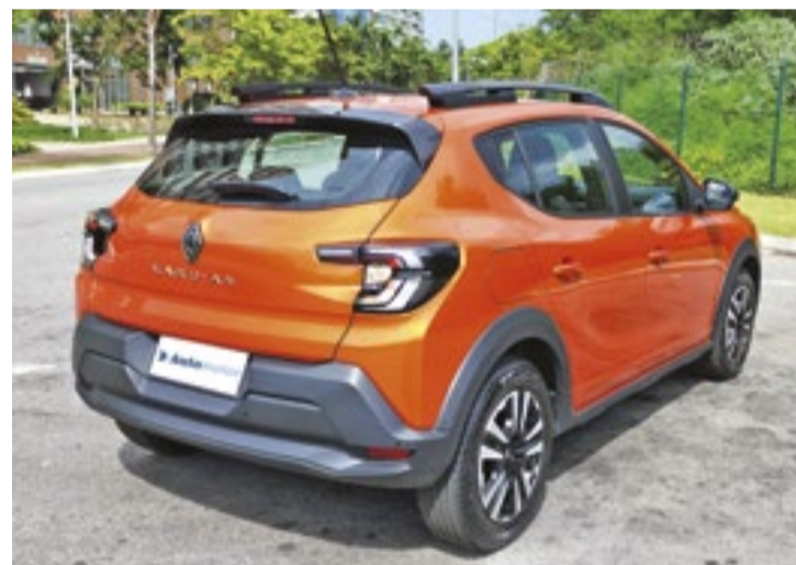
Kardian marcou a estreia da plataforma Renault Group Modular Platform (RGMP)

No quesito segurança, os principais itens de série são os seis airbags (frontais, laterais e de cortina), o assistente de partida em rampa e o controle de estabilidade (ESC), controlador e limitador de velocidade, a câmera de ré, o sensor de estacionamento traseiro, o monitoramento da pressão dos pneus, o alerta de afivelamento dos cintos de segurança para to-