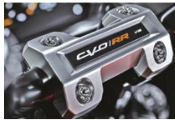
O novo motor Screamin' Eagle 131 V-Twin é a variante Milwaukee-Eight mais potente já oferecida de fábrica