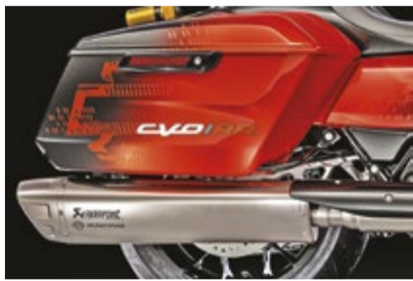
A Harley-Davidson quer estabelecer um novo padrão para baggers de alto desempenho

sensível ao toque de 12,3 polegadas. Wi-Fi e Bluetooth permitem conexão sem fio e espelhamento com Apple CarPlay, ligados ao piloto por fones de ouvido, com serviços em tempo real, atualizações de tráfego, clima e mapas. A navegação incorporada é de série. As atualizações de software são feitas via "Over the Air" (OTA). A matéria na íntegra pode ser acessada no site da Gazeta.